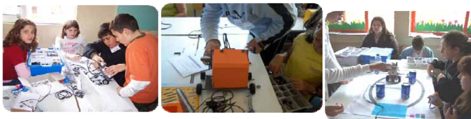
Εικόνα 1. Ομάδες στις τάξεις.